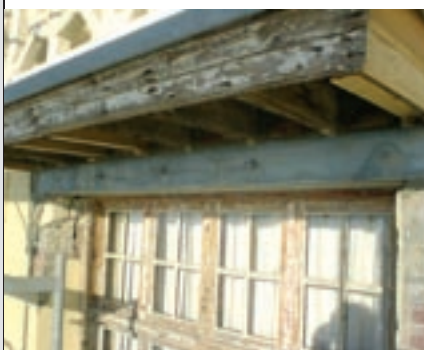
Sanacija konstrukcije sa čeličnim nosačima

Dakle, u konstruktivnom smislu Korać je izvršio izmene čeličnih nosećih profila iznad svih većih portala i otvora oštećenim u istorijskim događanjima kroz