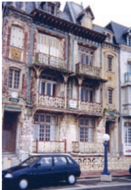
Izgled vile pred rekonstrukciju 2003. god.

Obnova Francuske posle II svetskog rata i vraćanje na svetsku političku scenu pod rukovodstvom mudrog generala i državnika Šarl de Gola, svakako je bio prvorazredni zadatak francuske nacije. Gradić Mers-les-Bains bio je pod anestezijom svih ovih godina kao uspavana lepotica, dok su nicala nova mondenska letovališta na Mediteranu i Biskajskom zalivu.