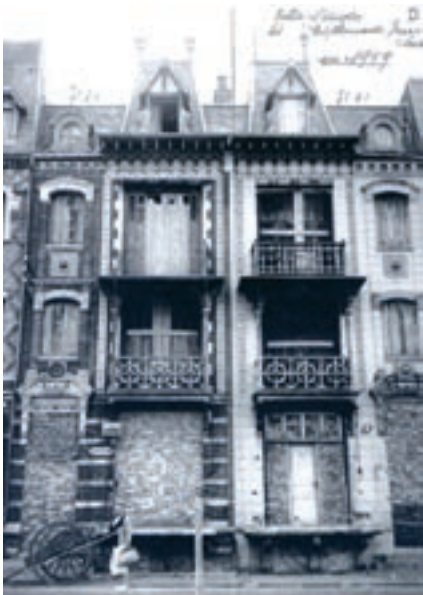
Izgled vile nakon drugog svetskog rata

se odvijala jedna od najstrašnijih bitaka u neposrednoj blizini na reci Somi, dok je srpska vojska istovremeno otvarala novi front na južnom krilu kod Soluna. Posledice rušenja i razaranja bilo je neophodno otkloniti na zgradama Mers-les-Bains-a s'tim što je taj zadatak dobila da uradi jedna nova generacija arhitekata opredeljena da stvara u stilu Belle epoque i Secesije tako da se na obnovljenim građevinama pojavilo novo bogatstvo detalja na fasadama, terasama, balkonima, ogradama, krovovima i otvorima.