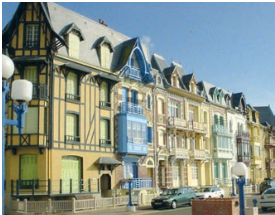
Novostvorene urbane ambijentalne vrednosti posle rekonstrukcije